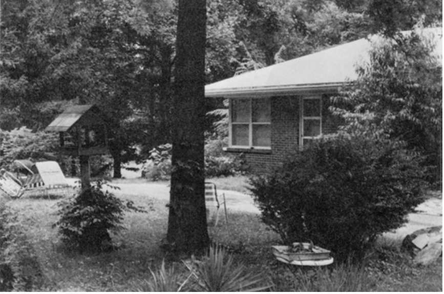
Ra odasının dış cephesi: kapı ve köşedeki pencereler, Ocak 1981'den beri süregelen Ra celselerinin yapıldığı odanın dış kısmının parçalarıdır. (Fotoğraf 9 Haziran 1982 tarihinde çekilmiştir.)