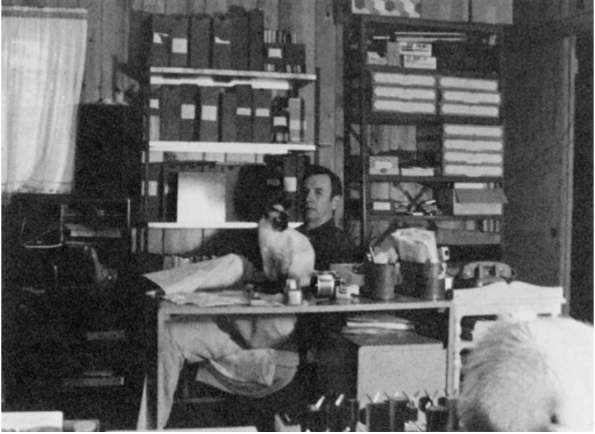
Don, ofisinde Jim ve fotoğrafçı ile konuşurken, bir yandan kedilerden oluşan bir dinleyici kitleleriyle. (Fotoğraf 26 Haziran 1982 tarihinde çekilmiştir.)